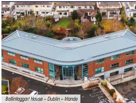
Ballinagart House – Dublin – Irlande

La SCPI n'a enregistré aucun arbitrage ce trimestre.