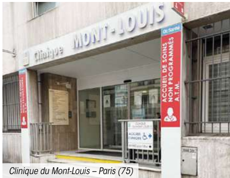
Clinique du Mont-Louis – Paris (75)