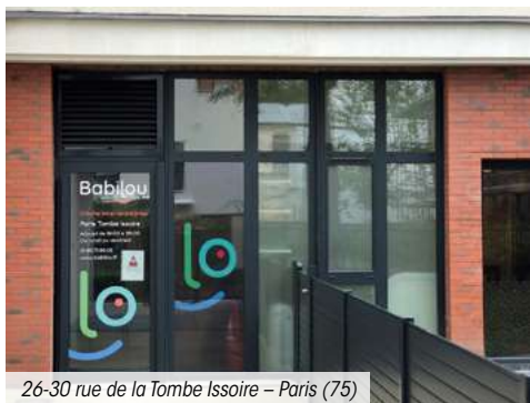
26-30 rue de la Tombe Issoire – Paris (75)